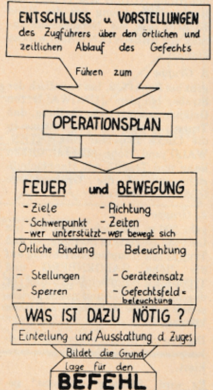
Bild 6: Schematische Darstellung eines Operationsplanes Vorschrift: Einzelanweisung für die Ausbildung der Jägertruppe F 5